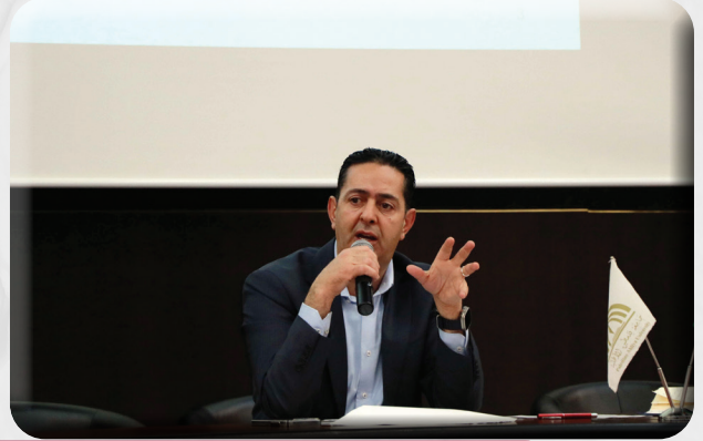
الدكتور عماد الزير، رئيس جامعة فلسطين الأهلية، يقدم محاضرة بعنوان "واقع التعليم العالي في فلسطين"